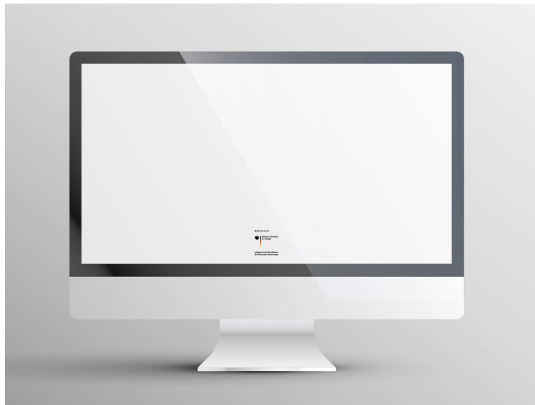
Abb. 2: Logo im Footer-Bereich einer Website

Eine Website bzw. eine Landingpage stellt die digitale Präsenz Ihres Projekts sicher. Hier können Sie auf die Projektziele hinweisen, Ihre Geschichten und Ergebnisse bewerben und Ihre Erfolge festhalten. Im unteren Bereich der Landingpage („Footer“) ist das BMV-Logo abzubilden.