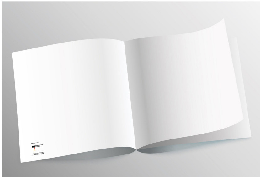
Abb. 1: Bei Broschüren empfiehlt sich, das Logo auf die Umschlagsseiten – hier etwa der U2, zu platzieren.

Die Platzierung des Logos hängt vom Design der Veröffentlichung ab. Um eine klare Trennung zwischen Fördermittelnehmenden und Fördermittelgebenden zu gewährleisten, sollte das Logo auf der Rückseite oder einer der Umschlagseiten (U2, U3 oder U4) platziert werden.