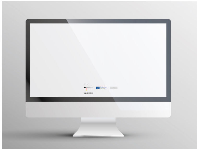
Abb. 2: Die Logos im Footer-Bereich einer Website

Eine Website bzw. eine Landingpage stellt die digitale Präsenz Ihres Projekts sicher. Hier können Sie auf die Projektziele hinweisen, Ihre Geschichten und Ergebnisse bewerben und Ihre Erfolge festhalten. Im unteren Bereich der Landingpage („Footer“) ist die für Sie geltende Logokombination einzusetzen.