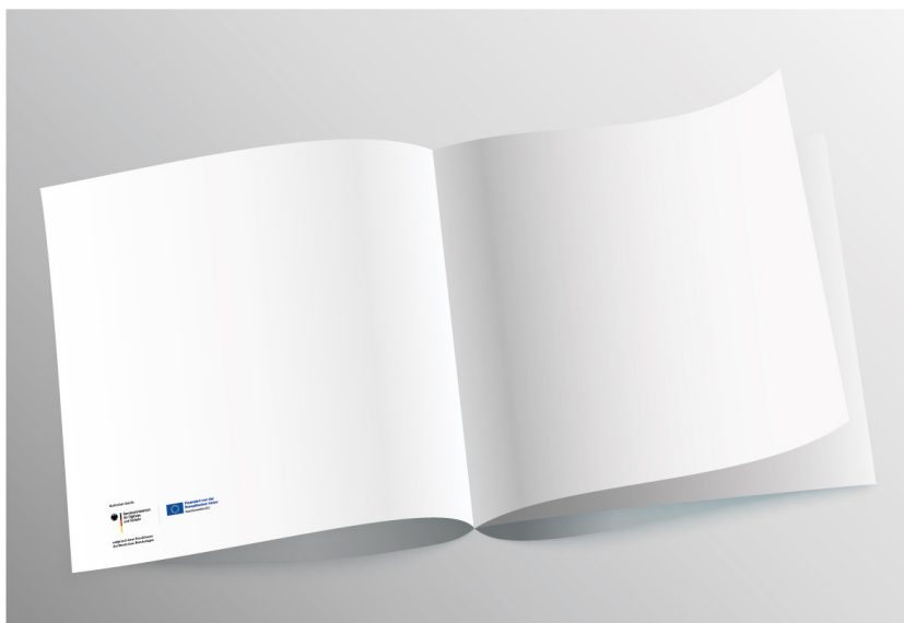
Abb. 1: Bei Broschüren empfiehlt sich, die Logo-Reihe auf die Umschlagsseiten – hier etwa der U2, zu platzieren.

Die Platzierung der Logos hängt vom Design der Veröffentlichung ab. Um eine klare Trennung zwischen Fördermittelnehmenden und Fördermittelgebenden zu gewährleisten, soll die Logo-Reihe auf der Rückseite oder einer der Umschlagseiten (U2, U3 oder U4) platziert werden.