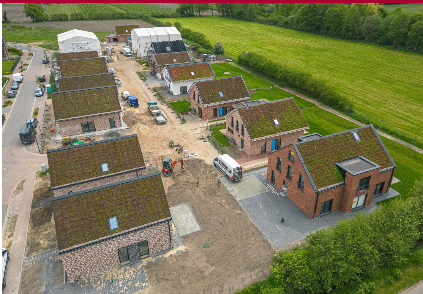
Smart City Harsefeld – Mai 2023